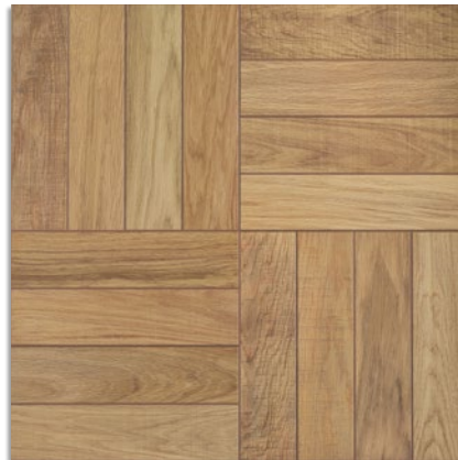
Feroe-C Natural G.199