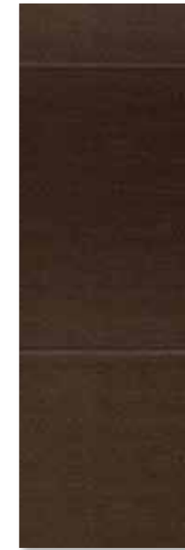
PLT 87 U 129 mokka matt · mocha satin