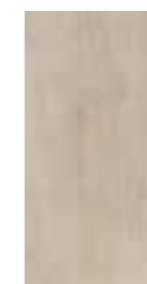
ROD 432 U 126 beige 45 x 90 cm