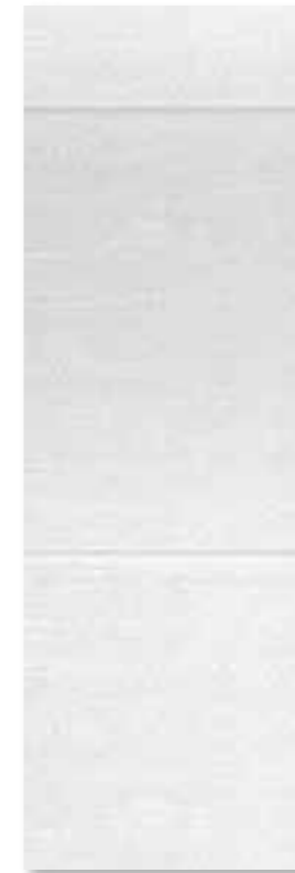
PLT 80 U 129 weiß matt · white satin

EN 14411 Glasiertes Steingut · glazed wall tile Kalibriert und rektifiziert · calibrated and rectified