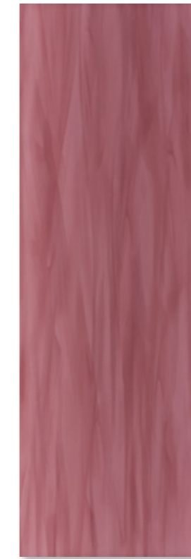
EME 83 U 127 rot glz. · red glossy