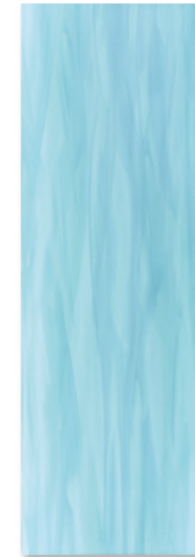
EME 84 U 127 blau glz. · blue glossy