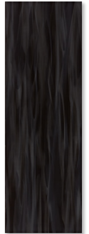
EME 85 U 127 schwarz glz. · black glossy