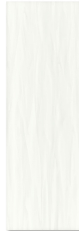
EME 80 U 127 weiß glz. · white glossy